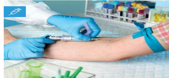
Toma de muestras