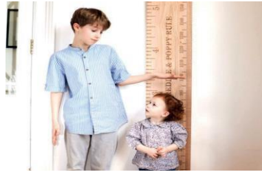
CRECIMIENTO Y DESARROLLO